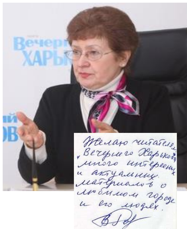
У редакції газети «Вечерний Харьков». Жовтень 2014 р.